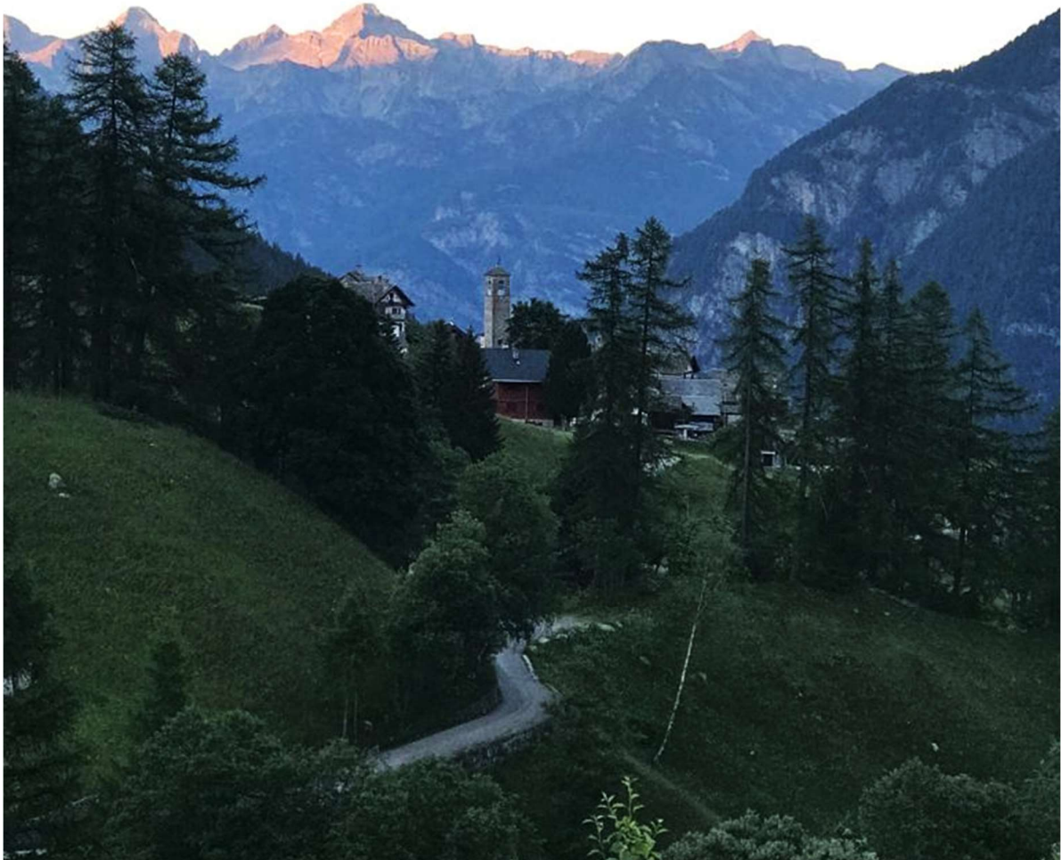
Munt la Reita Ti, Lager der 7. Klasse

Nur noch eine Woche Schule – dann sind endlich die Sommerferien da! Wer denkt das nicht in diesen heißen Tagen? Ich möchte deshalb meinen Schwerpunkt in diesen Zeilen auf die Lager lenken, die viele Klassen erleben durften, sozusagen als Vorfreude auf die schulfreie Zeit.